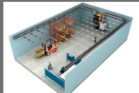
U-förmiges Push/Pull-System mit 1 Filtereinheit und 1 Lüfter

Plymovent bietet eine Vielzahl hochwertiger Qualitätsprodukte zum Schutz der Mitarbeiter vor gesundheitsschädigenden Luftverunreinigungen. Wenn Sie sich überzeugen möchten, welches System gerade für Sie das richtige ist, setzen Sie sich bitte mit Plymovent in Verbindung oder besuchen Sie unsere Website unter www.plymovent.de .