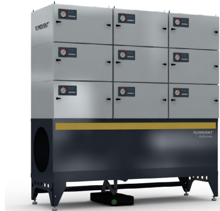
Se muestra: ME-42/3

ME-4X/2 y ME-4X/3 son bancos de filtración de base sencilla . ME-4X/4 y ME-4X/5 son bancos de filtración de base doble que se componen de dos bancos de base sencilla interconectados.